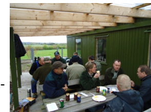
Frokost på arbejdslørdag anno 2010