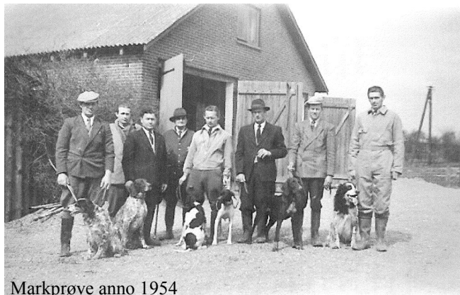
Markprøve anno 1954